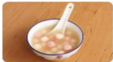
5 熱呼呼的湯圓完成了。