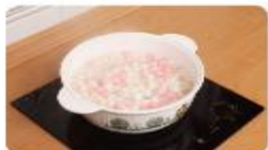
3 熱湯圓會變大浮起來。