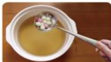
4 撈起湯圓放入糖水。