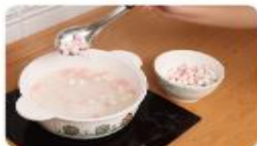
2 把湯圓放入煮開的熱水中。