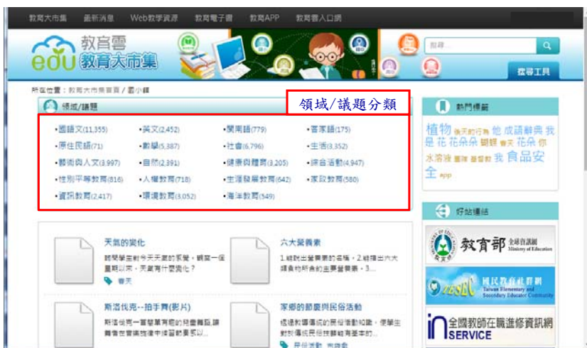
教育大市集建置計畫