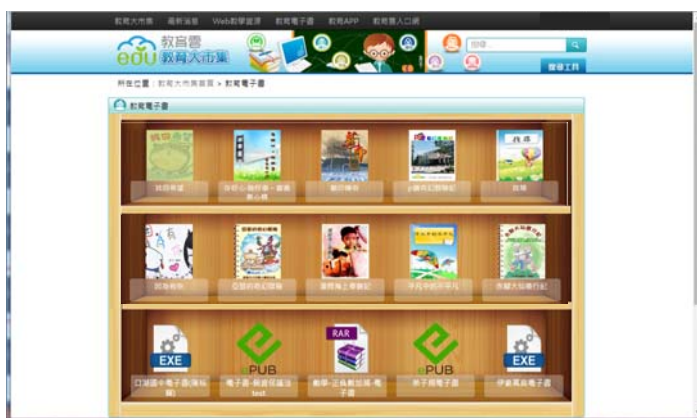
教育大市集建置計畫