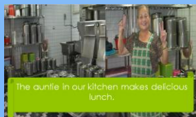
The aunty in our kitchen makes delicious lunch.