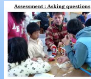
Assessment: Asking questions