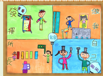
發揮所長 做我自己 【林好柔 陳晴滢 馮亭絮】