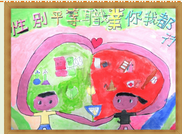
性別平等 職業你我都行 【李祐謙 陳冠成 鄭丞閔】