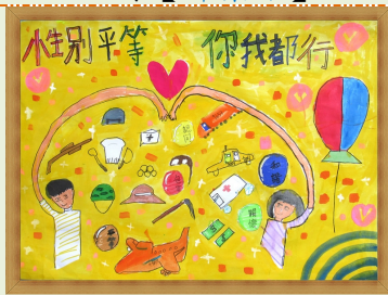
性別平等 你我都行 【林昱呈 高頌勛 周鼎恩】