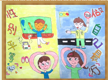
性別平等心 做自己最行 【陳君晏 蕭嘉璇 吳婉好】