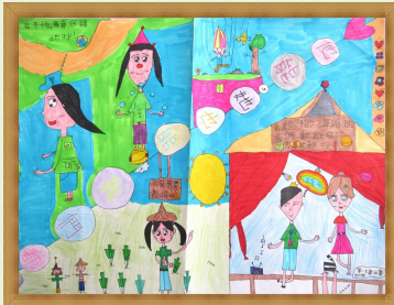
他能 她能 我們都能 【王妍雅】