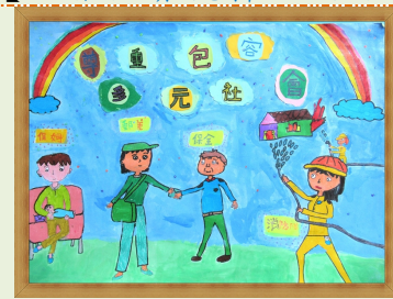
尊重包容 多元社會 【王宥煊 楊儀琳 洪婉玲】