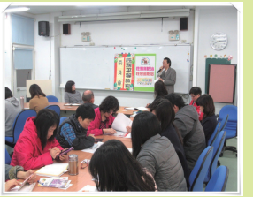
林主任宣導性剝削防治