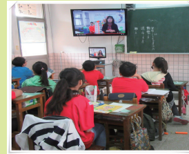
校長宣導性別平等