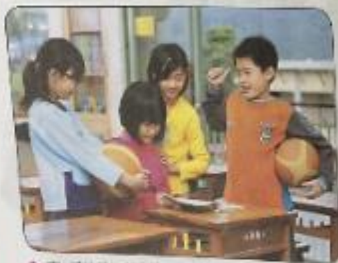
1. 內向害羞的同學，大家一起陪伴她。

對於功課比較落後的同學，大家多幫他一點； 1. 內向害羞的同學，大家一起鼓勵他、陪伴他； 2. 當同學犯錯時，我們要提醒他，對於勇於認錯的同學，要支持他。