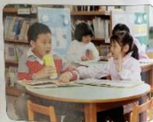
2. 當同學犯錯應給予勸告。