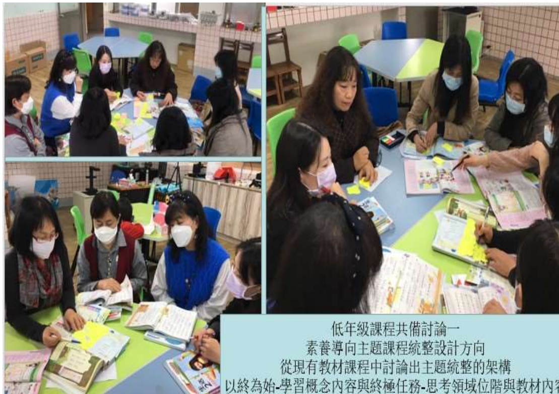
低年級課程共備討論一 素養導向主題課程統整設計方向 從現有教材課程中討論出主題統整的架構 以終為始-學習概念內容與終極任務-思考領域位階與教材內容