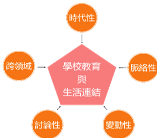
圖 1.1.1 議題的特性