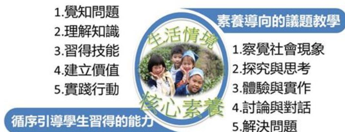
圖 1.2.1 議題的教與學

本次十二年國民基本教育課程以「自發」、「互動」及「共好」為基本理念，「核心素養」為課程發展主軸，並強調議題融入課程。議題融入課程可從不同領域/科目角度對議題加以探究、分析與思考，提供跨領域整合的學習機會，彰顯問題的情境性與觀點的多元性。在進行時，宜循序引導學生覺知問題，掌握議題的知識理解，將各領域所習得的學科知能加以整合與應用，並培養學生對生活情境問題的分析與解決能力。另則藉由議題的可討論性，協助學生澄清價值，建立信念，且提供問題解決的學習與實踐機會，進而促使學生產生行動（參見圖 1.2.1）。由上所述，可知議題因其特性，將讓議題融入課程擴充原有領域/科目之學習，對於素養導向課程之落實，有加乘之效果。