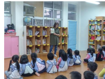
@小學部圖書館可以坐下來閱讀也可以借回家，幼兒園也有圖書室可以借書