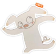
@小朋友說故事-幼兒自選的圖書 @老師說故事-幼兒感興趣的圖書