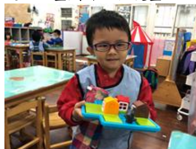
@玩故事桌遊-三隻小豬