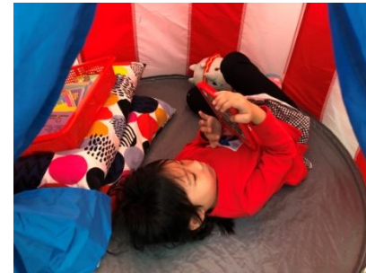
@故事帳篷裡可以看故事也可以聽故事