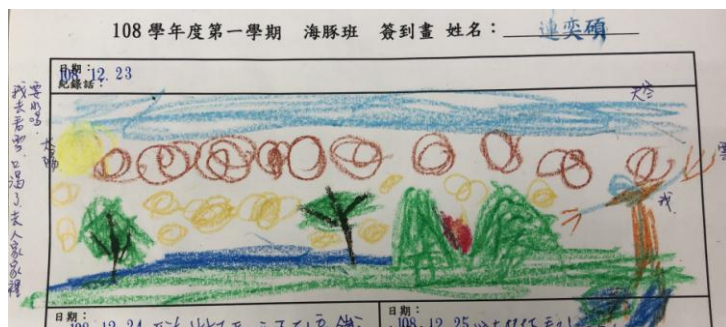
@日記畫-創作簡單的小故事

隨著主題活動的進行，老師與幼兒不斷的一起討論、探索與練習，幼兒們知道了一本書包含了封面、封底、故事內容、插畫、出版社、作者、畫家、翻譯……等基本架構，也知道了故事內容需要包含主角(人)在什麼時候(時)在哪裡(地)發生什麼事(事)，並在日記畫中利用此架構說出自己所畫的內容。幼兒們在每天的日記畫練習中，增進了說故事、畫畫與創作能力，許多幼兒還學習了繪本故事中的畫風(例如四格漫畫)，並表現在日記畫或自製小書中，幼兒們提升了說故事能力、繪畫能力以及閱讀興趣，同時因為增加了上台分享自己作品或說故事的經驗，因此也提升了自信心及表達能力，達到了這個主題所想要達到的學習目標。