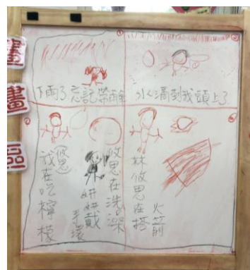
@故事創作-四格漫畫